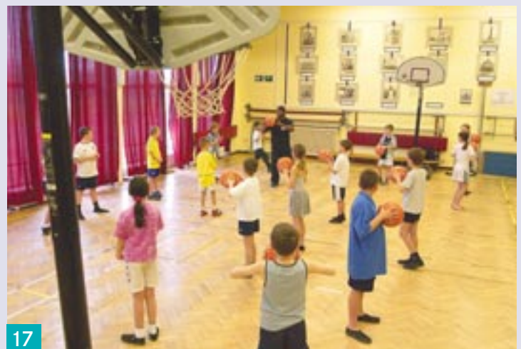
Bürgerstiftungen brauchen professionelles Management Die Community Foundation serving Tyne & Wear Northumber- land bereichert das soziale Leben im Nordosten Englands. Ihre Professionalität hat sie erfolgreich gemacht und ist Vorbild für Bürgerstiftungen in aller Welt.