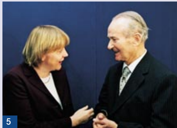
Herausforderungen einer neuen Gründerzeit Sehen Wettbewerb als Katalysator des Fortschritts: Die CDU-Vorsitzende Angela Merkel und Stiftungs- gründer Reinhard Mohn