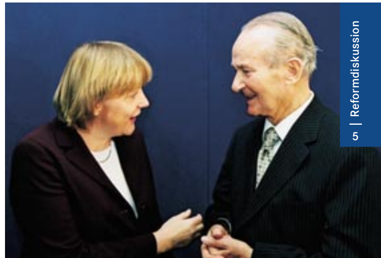
Einig in Grundsatzfragen: Die CDU-Vorsitzende Dr. Angela Merkel im Gespräch mit Stiftungsgründer Reinhard Mohn beim Kolloquium zum Thema: „Die gesellschaftliche Verantwortung des Unternehmers“

Wer alten Wohlstand erhalten und neuen schaffen will, muss mit den Veränderungen gehen und das Land reformieren. Freiheit und Gerechtigkeit, Wettbewerb und Kooperation, Leistung und Solidarität gehören in eine dem Wandel angemessene Balance. Die neue Soziale Marktwirtschaft ist Ausdruck dieser neuen Qualität von Wirtschaft, Politik und Gesellschaft.